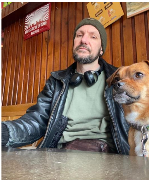
Bruxelles / visuel auteur

« Un voyage abrasif comme du papier de verre. »