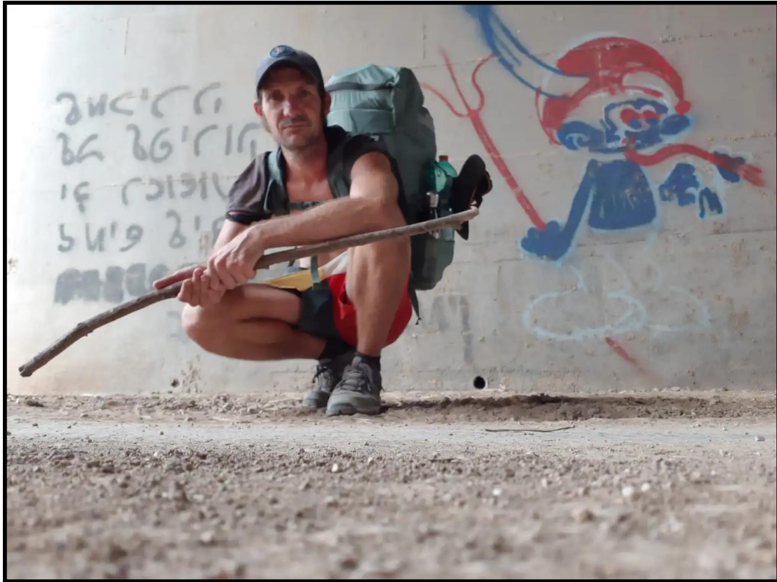
Traversée d'Israël à pied