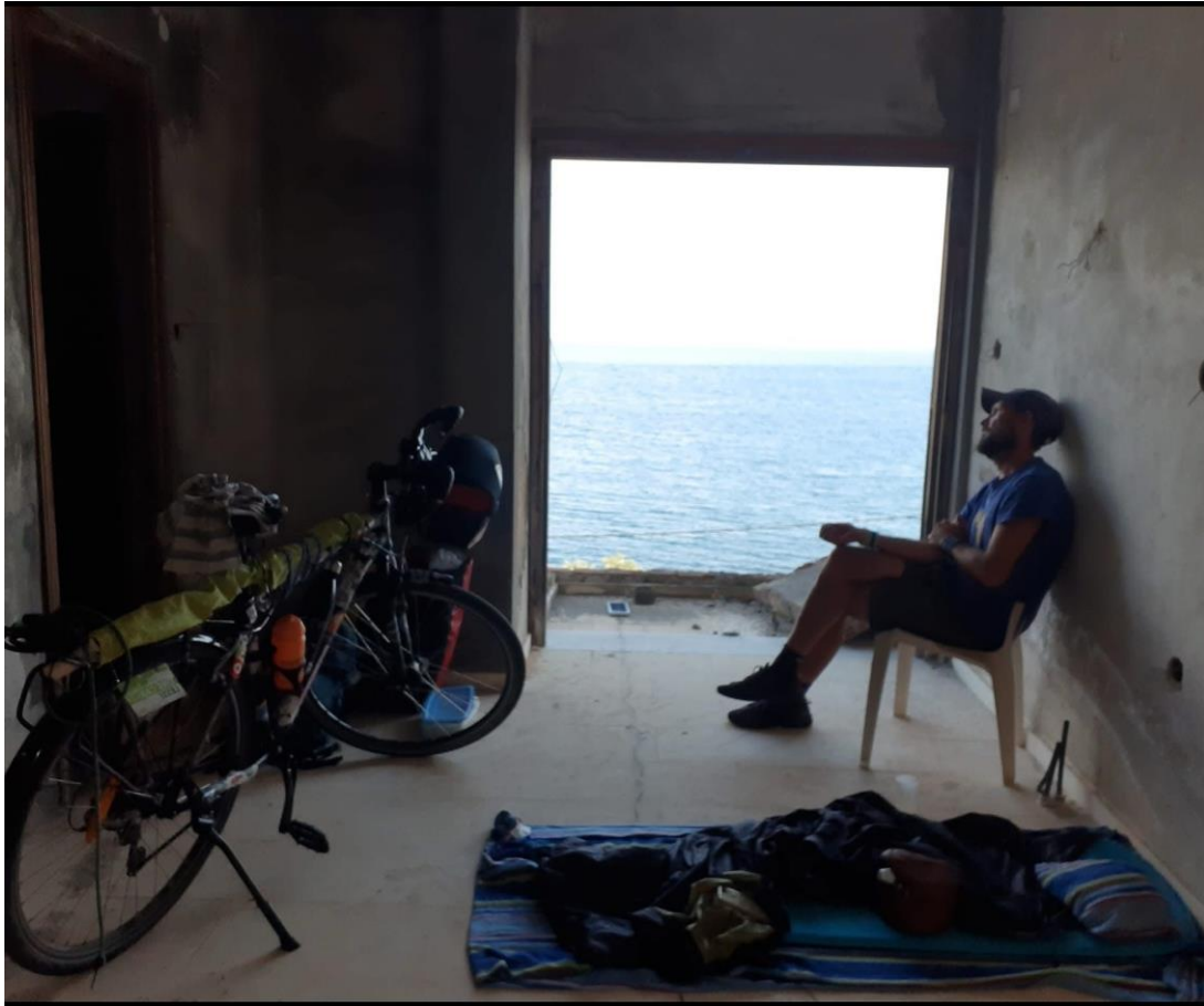
Île de Paxos